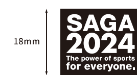
英語版(愛称・メッセージ一部省略)