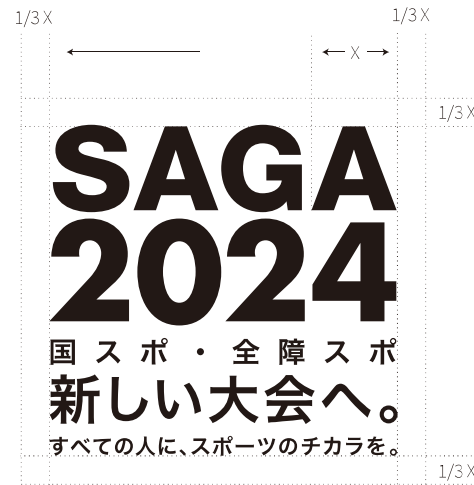
全文表記 四角組み