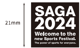
英語版(愛称・メッセージ)