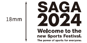
英語版(愛称・メッセージ)