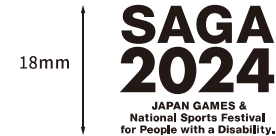
英語版(愛称・大会名称)