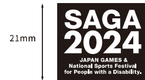
英語版(愛称・大会名称)