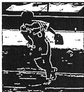
被安打1で完封勝利を挙げる (愛媛県 庄司選手)