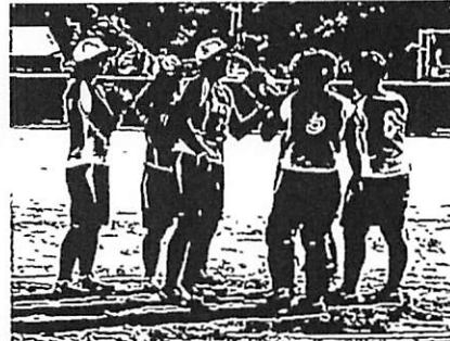
ピンチでマウンドに集まる (兵庫県 ナイン)