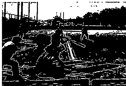
初回先制の2点本塁打 (兵庫県 氏丸選手)